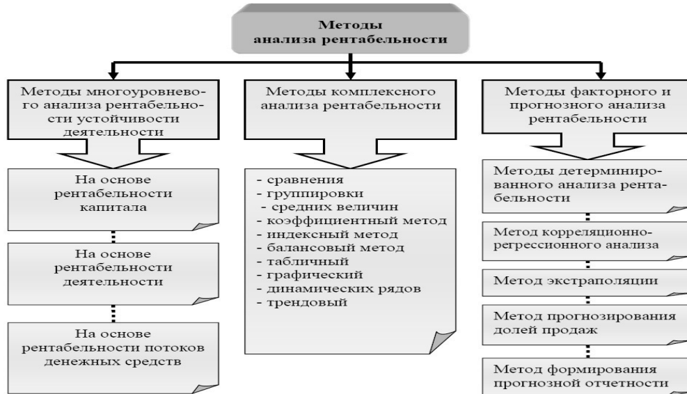
Рисунок 1. Основные методы анализа рентабельности организации

Графики, схемы, диаграммы, рисунки располагаются в курсовом проекте непосредственно после текста, в котором они упоминаются впервые, или на следующей странице. Иллюстрации следует нумеровать арабскими цифрами сквозной нумерацией (то есть по всему тексту) – 1,2,3, и т.д., либо внутри каждой главы – 1.1,1.2, и т.д.